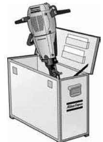
18. Caja de transporte