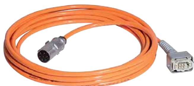
Cable de control de 10m para conectar el grupo hidráulico a una perforadora o una mural