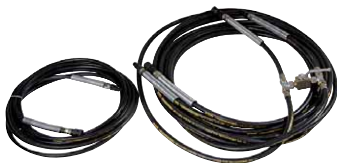
Kit de mangueras hidráulicas Para HA150 (15kW) v10 m 3 piezas sin control de bypass