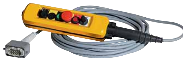
Control remoto completo con 10 metros de cable para HA200/HA300, disponible también para HA150. Alargaderas de 10m disponibles