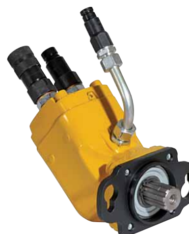
Motores hidráulicos de accionamiento de disco de 40 cm³, 60 cm³, 80 cm³ y 100 cm³