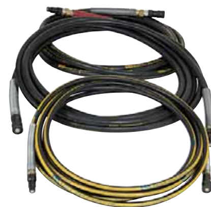
Kit de mangueras hidráulicas Para HA200/HA300 (20/30 kW), 10m 3 piezas sin control de bypass