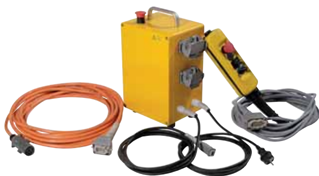
Control remoto eléctrico a 220/24V Completo con botonera y 10m de cable para cortamuros y perforadoras