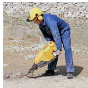
Apertura de zanjas